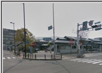
《京阪三条駅》徒歩6分